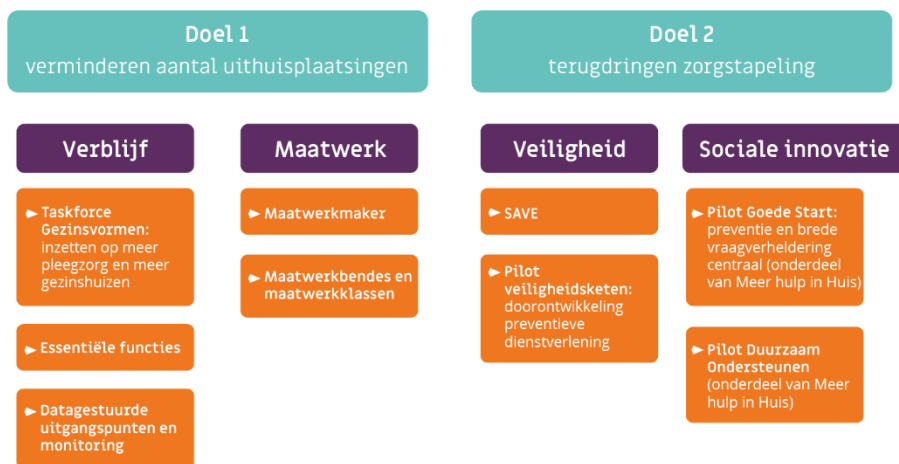
Figuur 2. Elementen van project 'Voorkomen verblijf'